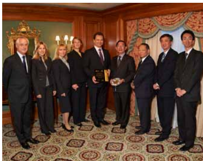
Участники церемонии подписания НРД и JASDEC Меморандума о взаимопонимании