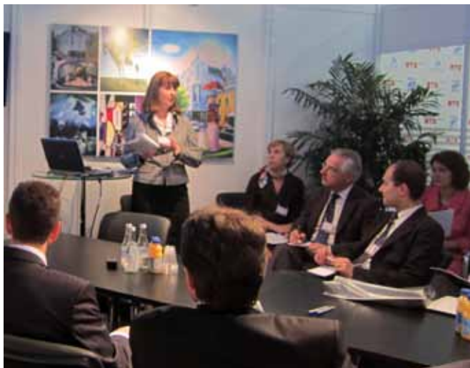
Семинар «Инфраструктура российского финансового рынка», организованный на стенде групп ММББ и РТС